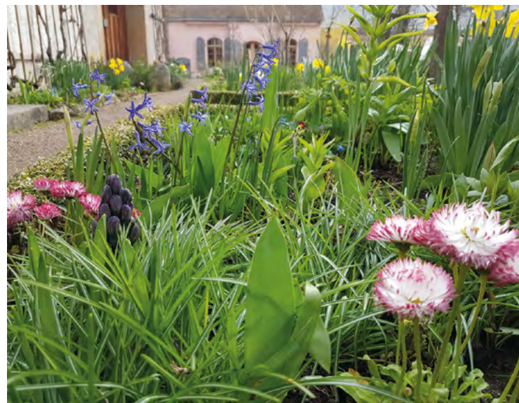
Frühlingsstimmung im Hausgarten

18-22 Uhr ) ein sommerlicher Abend voller Genüsse und musikalischer Klänge im historischen Ambiente des Kirms-Krackow-Hauses