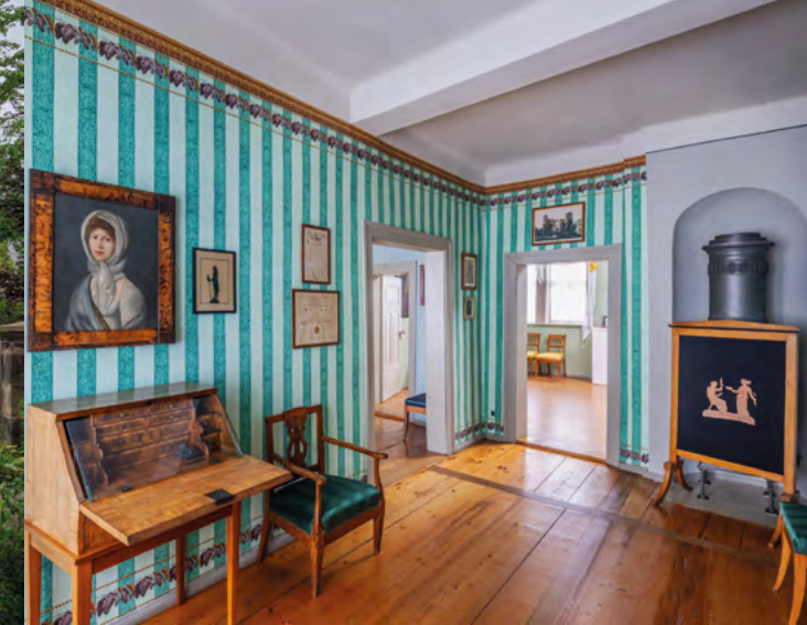
Arbeitszimmer mit vegetabiler Papiertapete

Angebot des Café Lieblingsgarten in Zusammenarbeit mit der Stiftung Thüringer Schlösser und Gärten