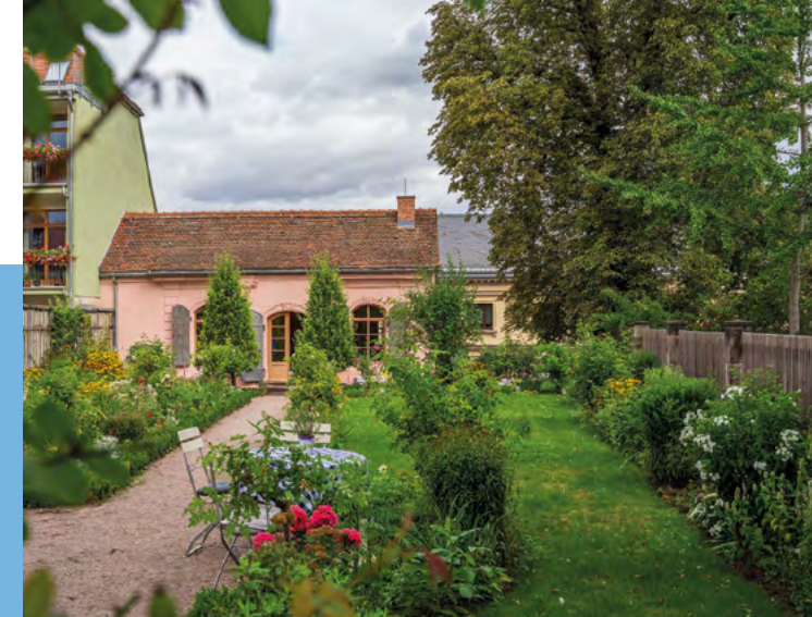
Biedermeiergarten mit Teepavillon