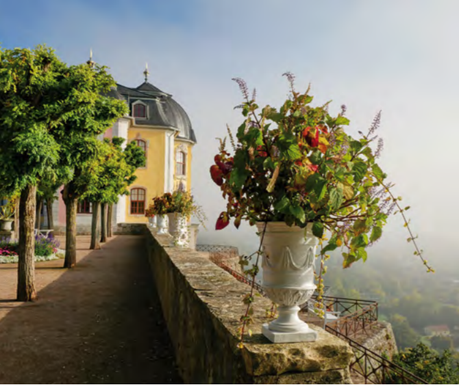
Ausstellung „Dornburger Jahreszeiten – Magische Momente“