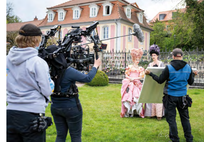
Dreharbeiten zum Märchenfilm »Zitterinchen«

11 Uhr ) Eröffnung der Fotoausstellung „Dornburger Jahreszeiten – Magische Momente“, Rokokoschloss (Mansarde) 14 und 15 Uhr ) Verborgene Räume, besondere Geschichte(n). Führungen im Alten Schloss, Treffpunkt: Altes Schloss (Innenhof) 17 Uhr ) Serenade im Lustschloss: Galant Gelehrt – Kammermusik der Barockzeit von Telemann, Bach u.a. Das Ensemble ThüringenBarock spielt auf historischen Instrumenten. Rokokoschloss (Festsaal)