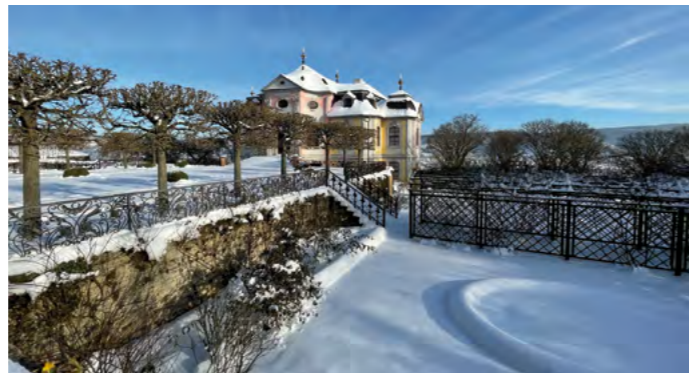
Winterzauber am Rokokoschloss