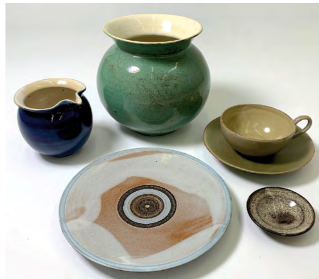
Aus der Sammlung Glum

Rundgänge: 1. Juni 13 Uhr | 27. Juni 15 Uhr | 5. Juli 14.30 Uhr | 25. Juli 15 Uhr (Treffpunkt Museumskasse)